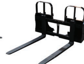
RECORRIDO 4,200 LBS