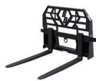
ANILLO EN D DE ALTA RESISTENCIA 4,000 LBS