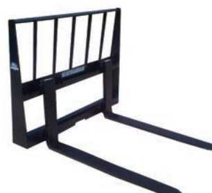
TRABAJO LIGERO 2,000 LBS

También están disponibles mini horquillas para paletas, horquillas hidráulicas para paletas, horquillas para guardería, lanzas para heno, horquillas especiales y púas de horquilla para bloques y ladrillos.