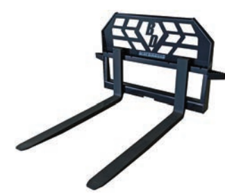
DEBER ESTÁNDAR 4,000 LBS