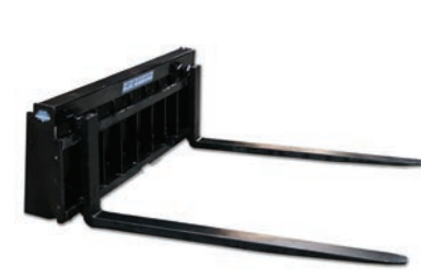
AMPLIO PERFIL BAJO 6,000 LBS