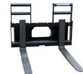
CLASE 3 10,000 LBS