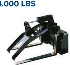
HORQUILLA DE PINZA 4,000 LBS