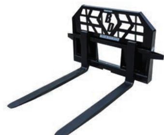
TAREA PESADA 4,000 LBS